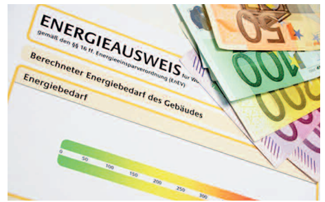
Der Energieausweis bewertet die energetische Qualität von Gebäuden

Janssen: Für die Erstellung des Bedarfsenergieausweises berechnen wir 378,- €. Dieser Ausweis ist 10 Jahre gültig und, wie gesagt, bei Immobilienverkäufen und -Vermietungen seit 2009 Pflicht. Ich biete aber auch eine Vor-Ort-Beratung an, in der der Energieausweis enthalten ist. Dies kostet 588,- €, wird aber zu 50 % vom Bundesamt für Wirtschaft und Ausfuhrkontrolle (BAFA) gefördert. Die Antragstellung dafür übernehme ich. Somit ist diese Variante mit nur 294,- € für den Eigentümer sogar günstiger und hat einen großen Mehrnutzen. Die Vor-Ort-Beratung enthält eine umfassende Dokumentation mit Vorschlägen für kon-